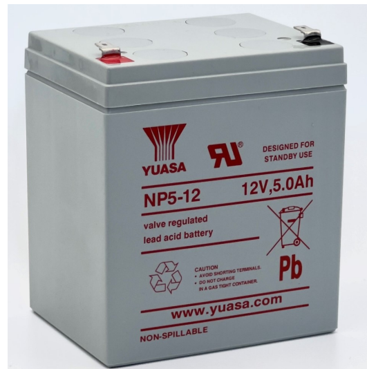
Layout - Abbildung ähnlich