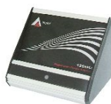
IMPROX RRA DESKTOP REGISTRATIE ANTENNE LEZER, wordt aangesloten op de Improx Registratie Interface