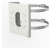
• Vertical pole mount