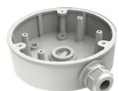
• Junction Box