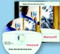
Remote Service Suite (RSS, Softwarepakket voor service op afstand) User Management Suite (UMS, Softwarepakket voor gebruikersbeheer)